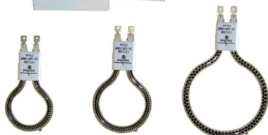
CFL600 CFL900 CFL1200