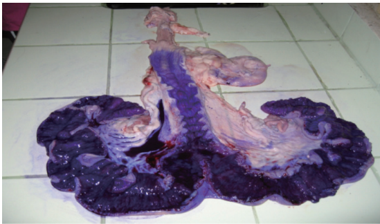
AMG カテーテルの場合